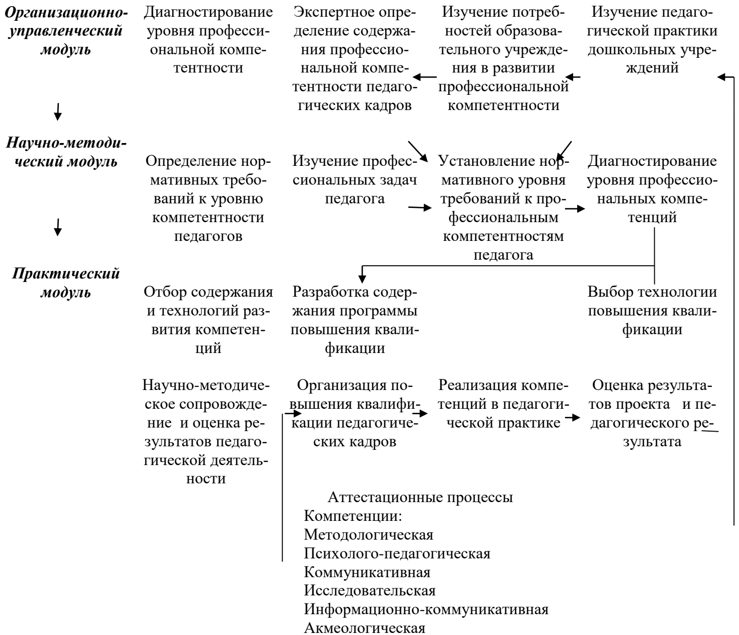
Рис 1. Модель организации повышения компетентности педагогических работников «Вектор развития»