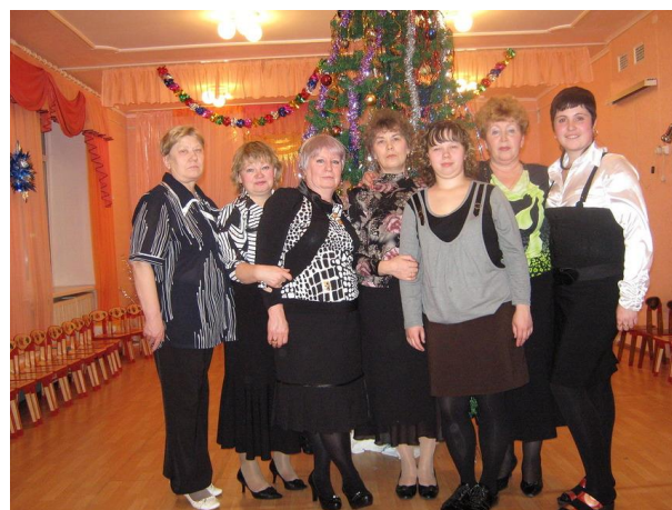
Камышлов, ноябрь 2016г.