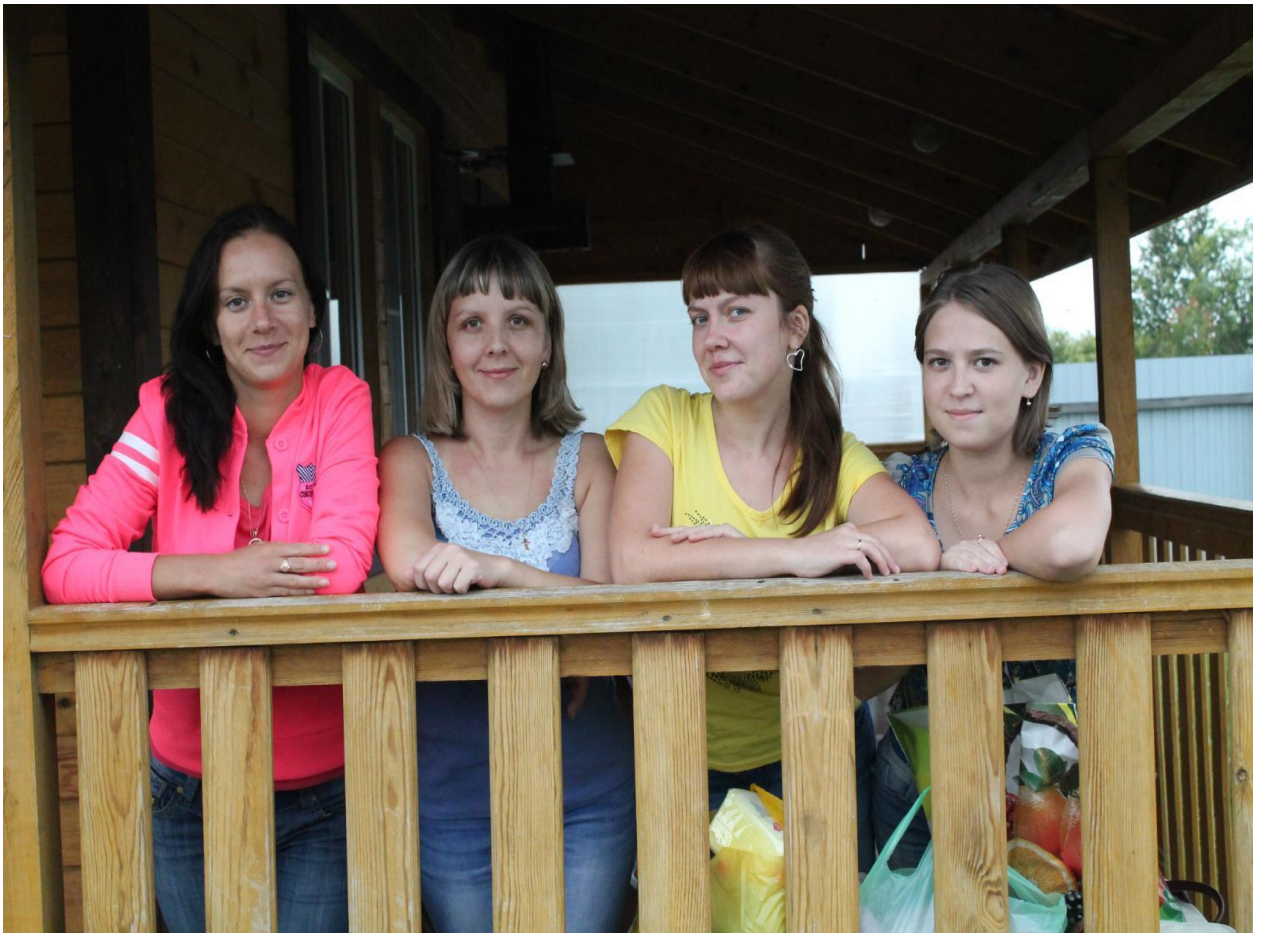
Выезд на природу