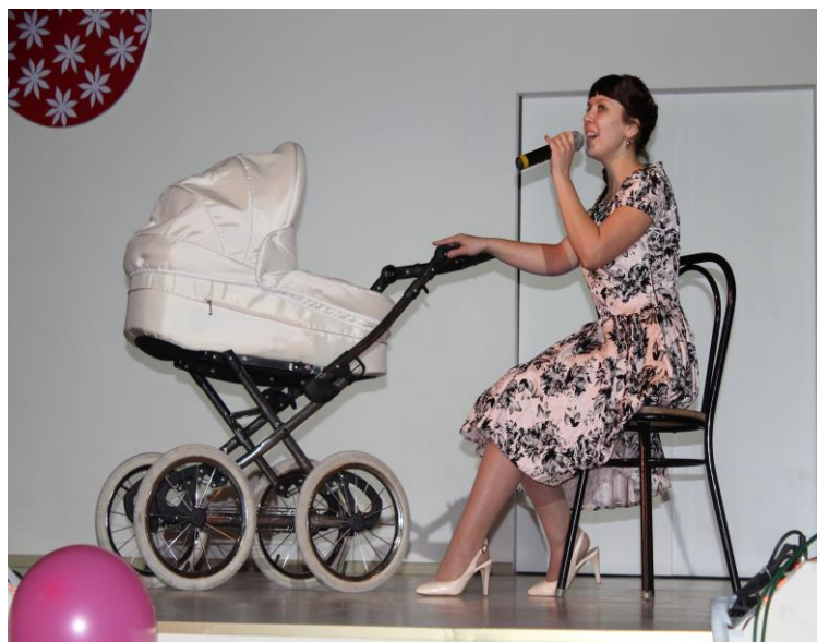
В конкурсе «В педагоге все должно быть прекрасно», 2015 г.