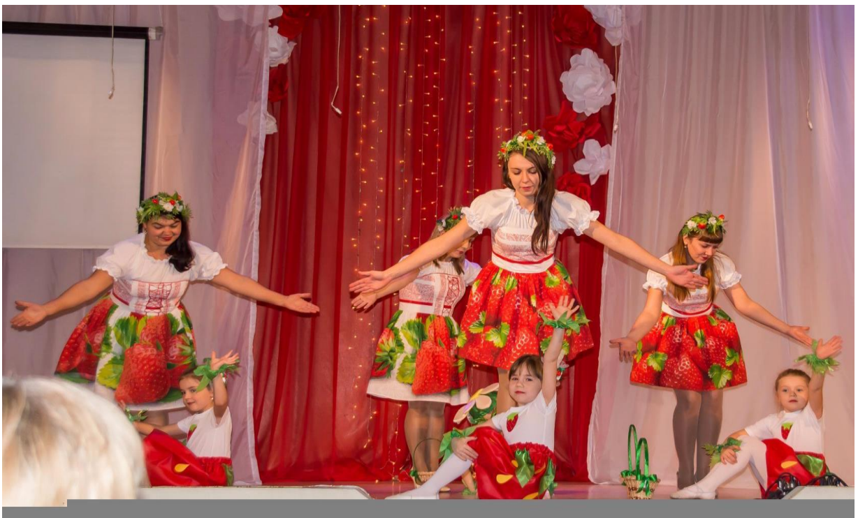
Участники областного фестиваля «Ситцевая радуга»