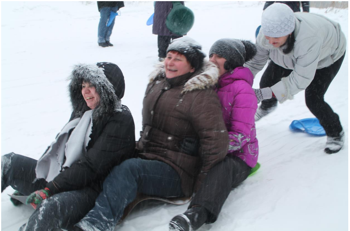
Катания с горок