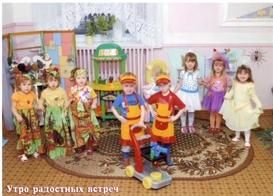
Утро радостных встреч

Девиз: Встречай с улыбкой новый день, не огорчай ни взрослых, ни детей.