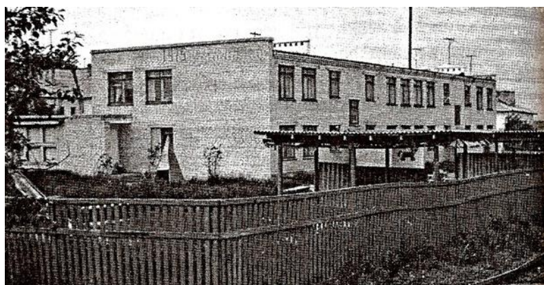
Фото здания детского сада №5 1994г.

Вот некоторые памятные фрагменты территории детского сада.