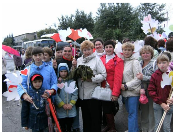
Коллектив на демонстрации